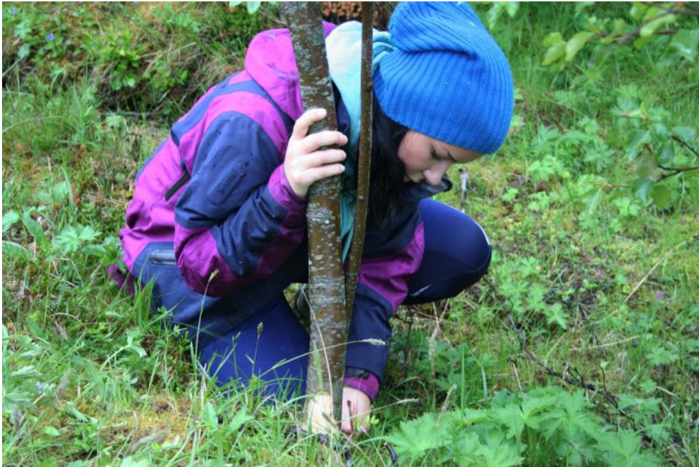
60 ELEVER FRA BRØNNØYSUND VIDEREGÅENDE SKOLE VAR I SKOGSHOLMEN I 2011 FOR Å LÆRE OM KULTURLANDSKAPSSKJØTSEL OG VEGETASJON, SLÅ GRAS OG RINGBARKE TRÆR SOM SKAL FJERNES. OGSÅ 10. KLASSE FRA VEGA SKOLE VAR I AKTIVITET...

Stiftelsen gjennomførte i 2009 – 2010 et skjøtelsprosjekt for ungdom i Skjærvær. I 2011 ble virksomheten flyttet til Skogsholmen og skjedde i samarbeid med grunneierne og Brønnøysund videregående skole. Også slåttarbeid for 10. klasse ved Vega skole ble lagt inn som fast aktivitet i Skogsholmen fra og med våren 2011. Prosjektet har vært finansiert med midler fra stiftelsen, SMIL-midler fra Vega kommune og Den naturlige skolesekken. Arbeidet er med utgangspunkt i foreslåtte tiltak i skjøtelsplanen for Skogsholmen og med veiledning fra Bioforsk Nord Tjøtta.