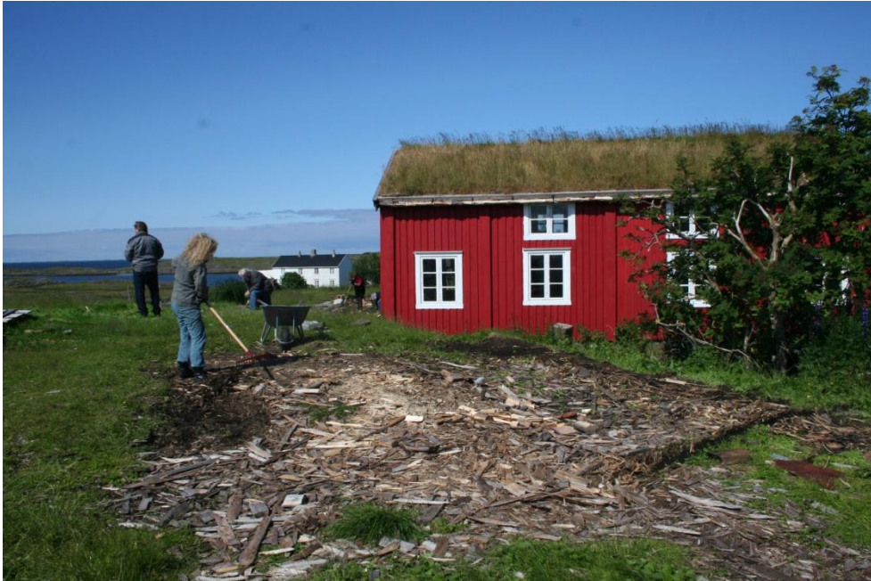
DUGNAD FØR ÅPNINGEN AV DET RESTAURERTE HUSET ØVERSTUA I TÅVÆR SOMMEREN 2011.

Etter avtale mellom Nordland fylkeskommune (NFK) og Helgeland museum (HM) har NFK engasjert museet til å følge opp deler av bygningsvernarbeidet i verdensarvområdet gjennom en egen 2-årig prosjektstilling som bygningsvernkonsulent. Arbeidet består i tilstandsvurdering, rådgivning i restaureringsarbeidet mv.