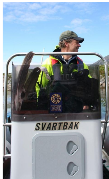
LOKAL OPPSYNSMANN HAR OPPSYN I DUNVÆRENE I HEKKESONGEN.

SNO deltar også på Stiftelsens halvårlege møter med fuglevokterne.