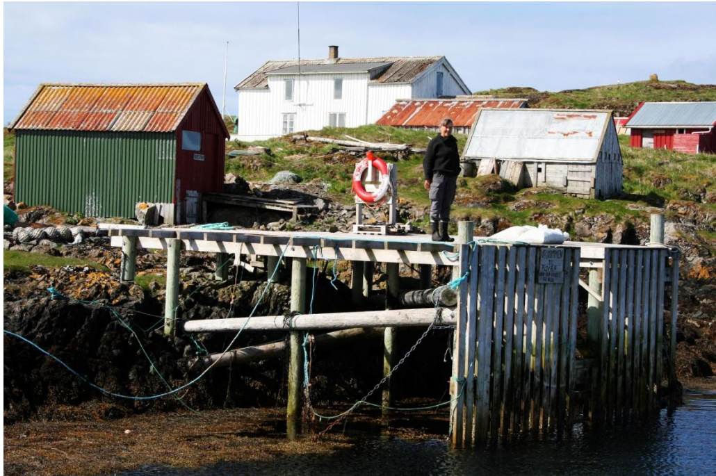
FLOVÆR, ET AV DE STØRSTE DUNVÆRENE, DER EIERNE HAR INNLEIDE FUGLEVOKTERE.

Stiftelsen hadde i 2011 knapt 4 mill til ulike tiltak og drift, hvorav 3,6 mill kr fra Direktoratet for naturforvaltning, 265 000 kr fra Nordland fylkeskommune og 100 000 kr fra Fylkesmannens miljøvernavdeling. Ellers bidro Statens Landbruksforvaltning med midler til kulturlandskapsskjøtsel, Nordland fylkeskommune med midler til bygningsvern, planarbeid og reiselivsstrategi, Innovasjon Norge og Vega kommune til pilotprosjektet Bærekraftig Reiseliv, Fylkesmannen i Nordland og Statens Naturoppsyn til predatorbekjempelse, hogst av sitkagran, merking av stier og kulturlandskapsskjøtsel og gjerding, Vega kommune og Helgeland Museum med midler og administrative ressurser til ulike prosjekt, sikring og utvikling av verdensarvområdet.