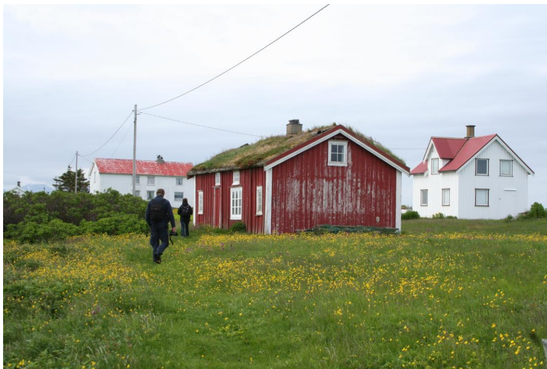
MARENSTUS I KILVÆR ER BLANT BYGNINGENE I VERDENSARVOMRÅDET SOM HAR FÅTT BYGNINGSVERN MIDLER.

Nordland fylkeskommune mottar midler fra Riksantikvaren til bygningsvernarbeid i verdensarvområdet og de to partene har i perioden 2010 – 2013 finansiert en 50 % prosjektstilling som bygningsvernansvarlig. Stillingen har vært lagt til Helgeland Museum og gitt et viktig løft på dette området som tidligere var preget av mangel på kapasitet og kompetanse, noe som i neste omgang førte til at flere bygningsvernprosjekt ikke ble igangsatt eller fullført. Stiftelsen mener det er svært viktig å kunne videreføre stillingen. For 2013 kom inn rundt 25 søknader på bygningsvernprosjekt fra Vega, noe som viser at stillingen har stor betydning. Tiltakshaverne ser mulighet for å igangsette slike prosjekt når de har en rådgiver før, under og etter søknadsprosessen - og med selve arbeidet. Stiftelsen mener det er viktig å ha en tett dialog med fylkeskommunen og Helgeland Museum om videreføring av prosjektet også etter forsøksperioden og om mulige samarbeidsprosjekt. Det vil være viktig å få utviklet en handlingsplan for bygningsvernarbeidet og at dette skjer i samarbeid mellom partene.