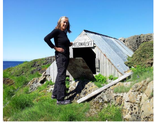
FORVALTNINGSKNUTEPUNKT NES MED SNO, VERNEOMRÅDEFORVALTER OG VERDENSARVKOORDINATOR BESØKTE ALLE DUNVÆRENE I 2013. HER FRA MUDDVÆR OG FLOVÆR.

Beredskapssituasjonen i forhold til den økende skipstrafikken, miljøgifter og plastavfall i verdenshavene som truer sjøfuglbestandene globalt, er andre trusler mot områdets fugleliv.