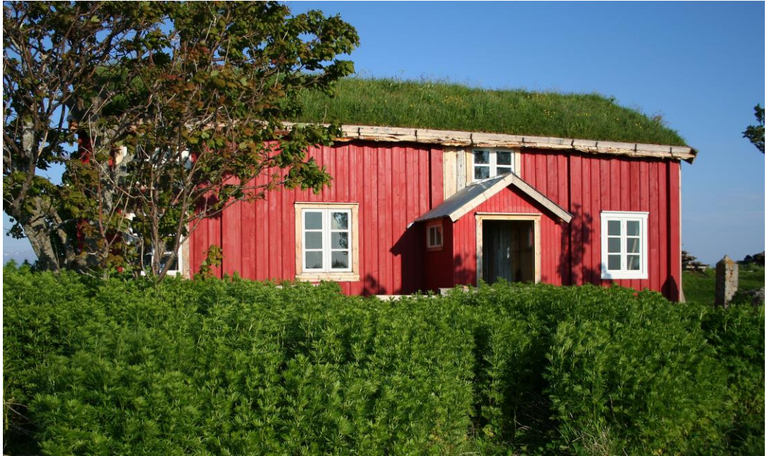
VEGAØYANS VENNER FEIRET 10 ÅRSJUBILEUM VED ØVERSTUA I TÅVÆR I 2013

Vegaøyans Venner hadde 75 medlemmer i 2013 og hadde flere arrangement og tiltak som er viktige bidrag til det lokale verdensarvarbeidet: