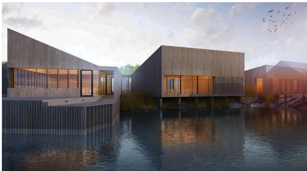
SKISSE AV FRAMTIDIG VERDENSARVSENTER PÅ VEGA VED ARKITEKTENE EKBERG/LOUS PR 31.12.2012