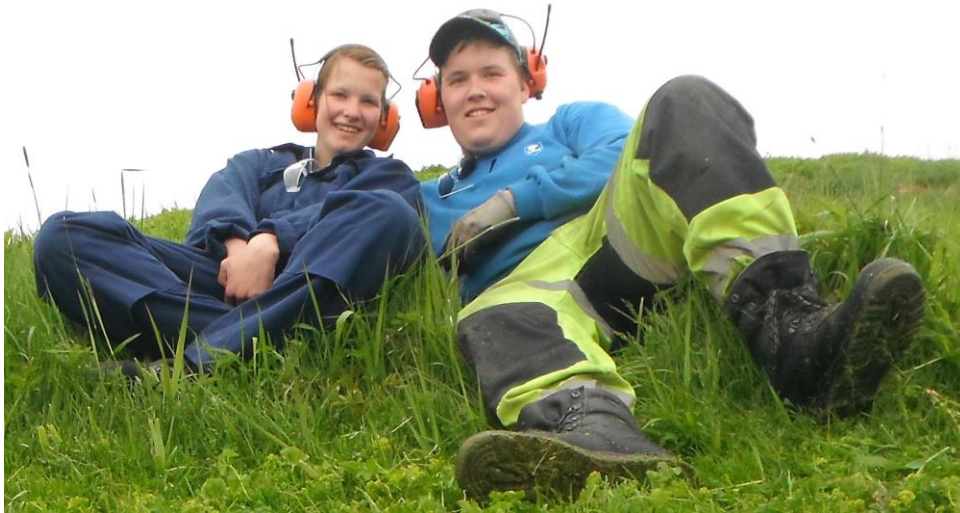
EN PUST I BAKKEN FOR ELEVER FRA MOSJØEN VIDEREGÅENDE SKOLE PÅ SKJØTSELSPROSJEKT I SKOGSHOLMEN.

skjøtsel i verneområdene. Men det ble likevel økning i skjøtselen i 2013 pga midlene via verneområdestyret.