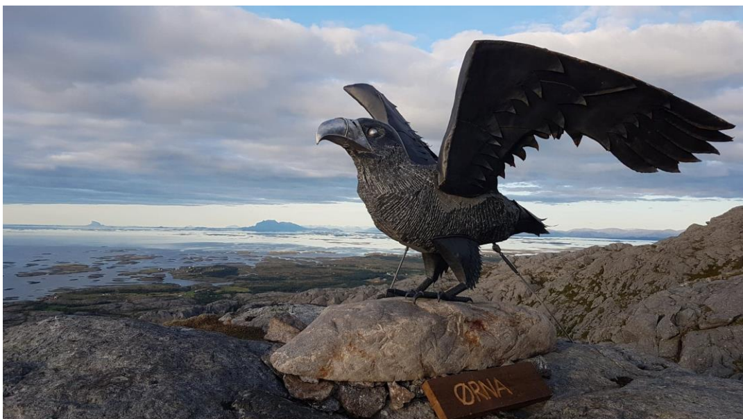
ØRNA PÅ TOPPEN AV VEGATRAPPA BLE ET POPULÆRT BESØKSMÅL I 2019

Midlene som er gått til Vegaøyans Venner er brukt til ulike arrangement og formidlingstiltak gjennom hele året, eks Ærfuglpatrulje til Bremstein for å hjelpe fuglevokter der, Øyans Dag og Fuglekveld. Arrangementene er godt besøkt. VegadaganUNG hadde egne ungdomsarrangement og kurs under Vegadagan sommeren 2019, mens Vega Kystlag har oppgradert utstillingene på Kystlagets Brygge. IL Vega har stått i spissen for arbeidet med Vegatrappa som ble åpnet helgen før Vega verdensarvsenter. Trappa ble et svært populært tiltak og både lokale og tilreisende var flittige brukere av trappa som gir god utsikt over verdensarvområdet. Per 25. september 2019 hadde 6500 skrevet seg i bøkene som ble lagt ut og de regnet med at det var veldig mange som ikke skrev.