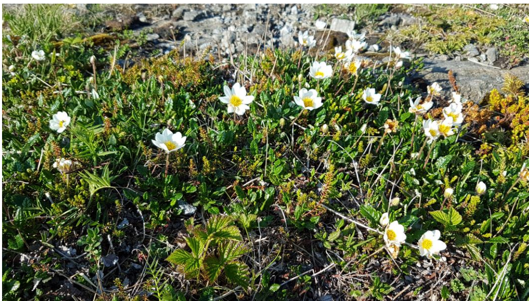
VEGETASJON PÅ KALKRIK GRUNN OG KYSTLYNGHEI ER KARTLAGT OG VIL BLI SYNLIGGJORT I «DYPDYKK»

Kartleggingen har siden 2012 vært kombinert med viltkartlegging, der Fylkesmannen har vært delfinansiør. Totalt var det registrert 244 fuglearter på Vega og i Vegaøyen. Det er først og fremst sjøfuglarter som ærfugl, siland, storskarv, gråmåke, svartbak, fiskemåke og rødnebbterne som er mest tallrike i skjærgården på sommerstid, men også arter knyttet til et velskjøttet kulturlandskap som stær, storspove, småspove, grågåås, heipiplerke og linerle er vanlige å se. Nibio og SNO har kartlagt fugleforekomster på våren på Hysværflaket; et viktig overvintrings- og rasteområde for sjøfugl. Observasjonene er lagt inn i Artsobservasjoner www.artsobservasjoner.no I tillegg har Stiftelsen hvert år mottatt en rapport om det utførte oppdraget.