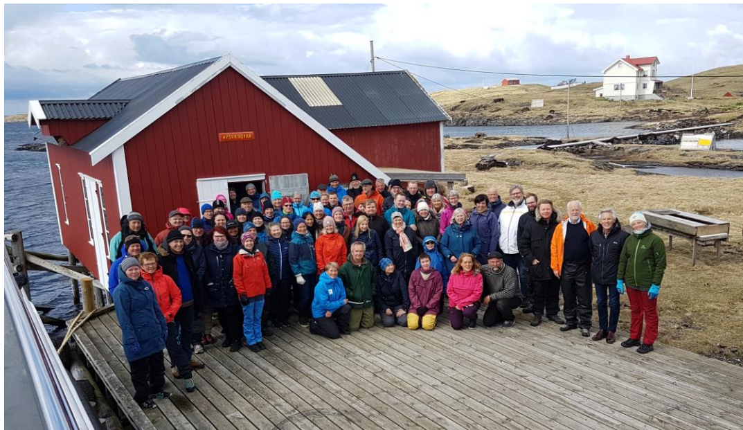
DELTAKERNE PÅ VERDENSARVFORUM FIKK BLI KJENT MED ÆRFGULTRADISJONEN I HYSVÆR

Norges Verdensarv, medlemsorganisasjonen for de norske verdensarvstedene med samarbeidende instanser, arrangerer årlig Verdensarvforum, en arena for felles erfaringsutveksling og kompetanseoppbygging. 6. - 9. mai 2019 var Verdensarvforum lagt til Vega og Vegaøyen Verdensarv med rundt 100 deltakere fra lokalsamfunnet og de syv andre verdensarvstedene. 10 år etter at Verdensarvforum for første gang ble arrangert på Vega, var konferansens tema: Hva er fyrårstrategi de neste 10 år for verdensarvstedene. Verdiskaping med basis i verdensarven.