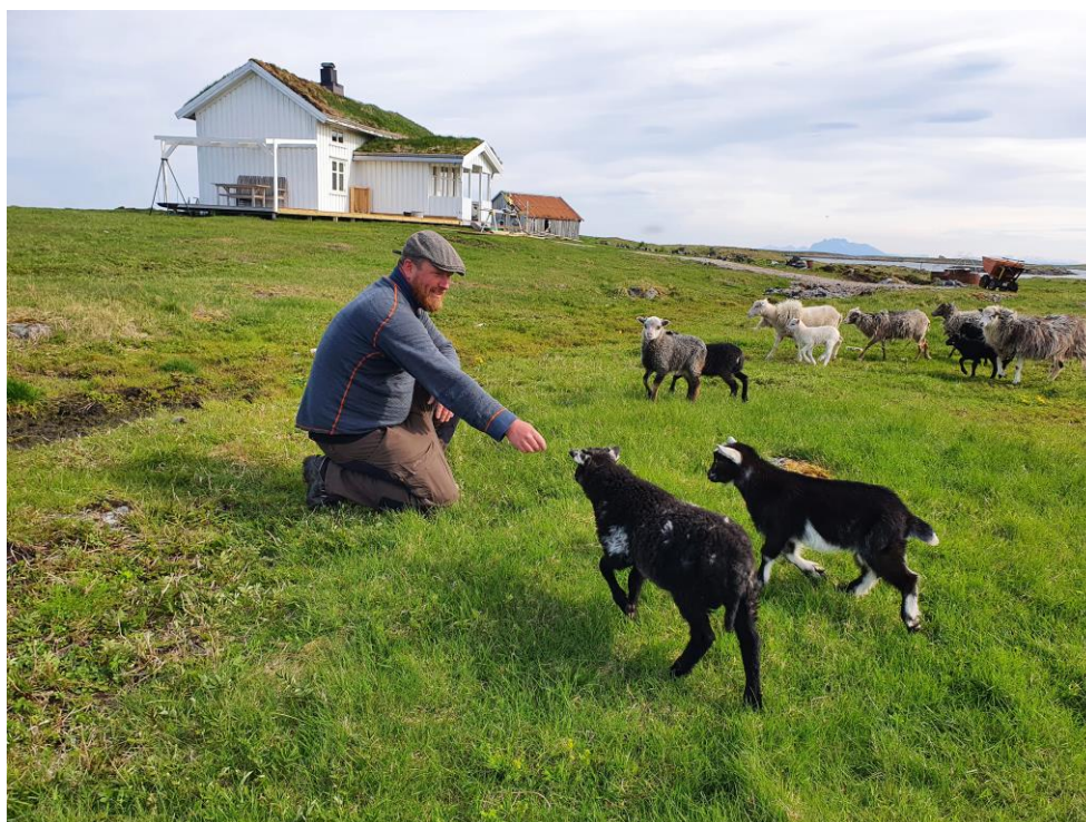
BEITING MED GEIT KOMBINERT MED SLÅTT HAR GITT SVÆRT GODE RESULTATER PÅ STEINSHOLMEN

Satsningen på tiltak innen kulturlandskap i verdensarvområdene Vegaøyen og Vestnorsk Fjordlandskap ble i 2020 gjenspeilt i statsbudsjettet og via jordbruksavtalen. Det har gitt mulighet til å følge opp og iverksette en rekke viktige tiltak. Av et totalbudsjett for 2020 på 4,411 mill kr som skulle dekke arbeidet på alle forvaltningsplanens områder, satte Stiftelsen av 2,6 mill kr til skjøtsel og duntradisjonen. Vega kommune tildelte 1,52 mill kr via LUF-midlene der Kr. 735 000 er gitt til skjøtsel i verdensarvområdet (beite og slått) og Kr. 792 525 er gitt til andre tiltak. Vega verneområdestyre bidro med 563 200 kr til skjøtsel i de vernede områdene. Økningen av LUF-midlene åpnet også for midler til to prosjekter i Stiftelsens regi utenom skjøtselstiltakene som ble fullført i 2020: