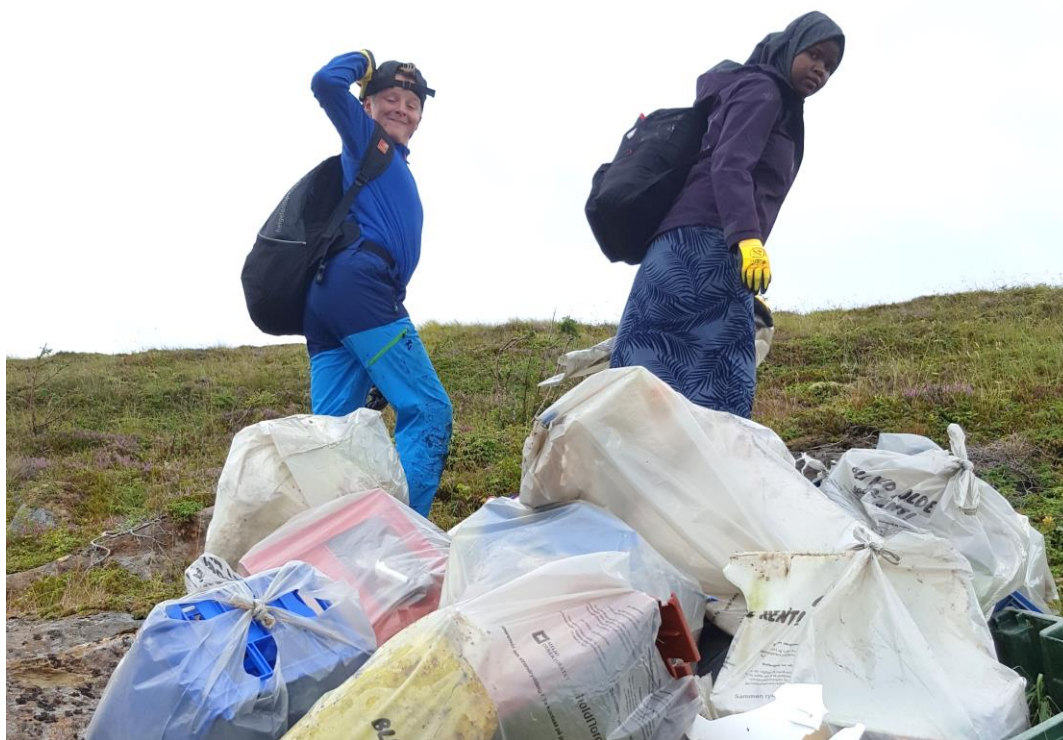
HANDELENS MILJØFOND BIDRO MED TILSKUDD TIL HOLD VEGAØYA VERDENSARV REN OG 9. OG 10. KLASSE PLUKKET SEKS TONN MARINT AVFALL SOMMEREN 2020

I 2014 - 2020 har regionalt og lokalt næringsliv gitt sponsorbidrag til verdensarvsenteret og «Eventyret Vegaøyen Verdensarv» og «Heltens reise» på nesten 5 millioner kr. I tillegg kommer instanser som Helgeland Museum, Statens naturoppsyn, skolene, grunneiernes og frivilliges innsats i området. Det er grunn til spesielt å trekke fram fuglevokterne og bønder lokalt som tar på seg et stort arbeid med å frakte dyr i båt over lange avstander for å få beitet øyene, samt alle skoleelevene som bidrar aktivt i Vegaøyen og verneområdene på Vega. Videre gjennomføres det en rekke arrangement i regi av frivillige lag og foreninger som bidrar til å formidle natur- og kulturverdier og skape opplevelser.