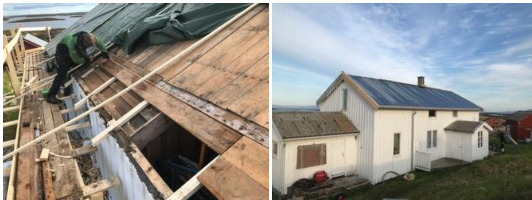
HÅNDVERKERE RESTAURERTE TAKET PÅ HOVEDHUSET I FLOVÆR I 2020. DETTE VAR ETT AV 18 TILTAKENE SOM FIKK TILSKUDD VIA RIKSANTIKVAREN/NORDLAND FYLKESKOMMUNE.

Framover vil det være viktig å få styrket opplæringen av nye håndverkere. Vega mangler fagfolk som kan ta på seg restaureringsprosjekter. Per i dag er det 400 Sefrak-registrerte bygg og 80 av disse er istandsatt. Helgeland Museum startet i 2020 med å få etablert et bygningsvernsenter på Vega med en bygningsvernleder i full stilling som skal arrangere kurs oa tiltak for kompetansebygging. Se side 29.