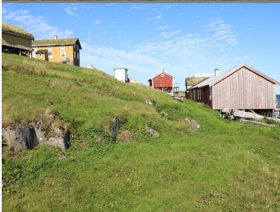
REFOTOGRAFINGEN FRA VEGAØYAN I 2020 VISER DEN STORE INNSATSEN SOM ER LAGT NED AV GRUNNEIERNE PÅ ULIKE ØYER I VERDENSARVOMRÅDET. HER FRA SKJÆRVÆR.