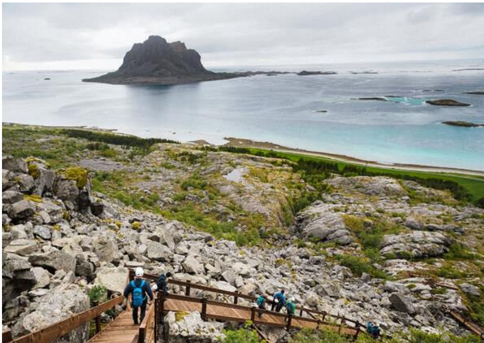
FYLKESRÅDET I NORDLAND VEDTOK I 2020 Å OPPRETTHOLDE SITT OPPRINNELIGE VEDTAK OM Å GI MOWI FEM ÅRS DISPENSASJON TIL OPPDRETT VED RØRSKJÆRAN.