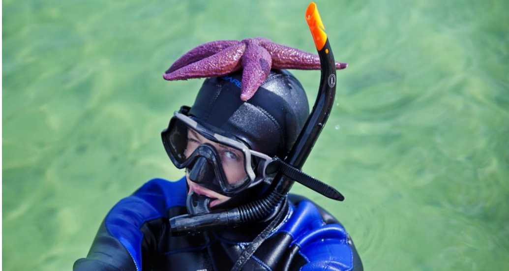
SNORKELØYPA MED UMLEIE AV SNORKELUTSTUR HAR VÆRT TILBUD FOR BARN OG VOKSNE I 2020

Hold Vegaøyen ren: Prosjektet Hold Vegaøyen ren ble gjennomført med 18 ungdommer i alderen 14 - 16 år som samlet inn 6 tonn marint avfall. Det skjedde i samarbeid med organisasjonen In The Same Boat i forhold til båttransport av strandryddere og avfall.