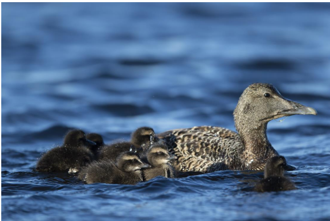
SJØFUGLENE SLITER I VERDENSARVOMRÅDET SOM ELLERS LANGS KYSTEN. MEN VEGAØYAN HAR HATT EN BEDRE UTVIKLING FOR ÆRFUGLENE ENN ANDRE STEDER LANGS KYSTEN I NORD.

SNO har som tidligere bistått verneområdeforvalter ved en del oppdukkende oppgaver og transportbehov.