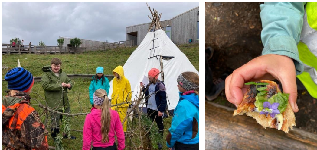
«MED STEIN OG PLANTE RUNDT ÅPEN FLAMME»: MAT- OG SANKEVERKSTED FOR BARN BLE GJENNOMFØRT I 2021.

Pga pandemien ble det ikke gjennomført workshops for barn og unge i 2020. Det gjensto derfor en rest på kr 20 000 som kunne omsøkes i 2021. Disse midlene ble brukt på en workshop for barn om mat i naturen med kunstnerne Kvae og Bark.