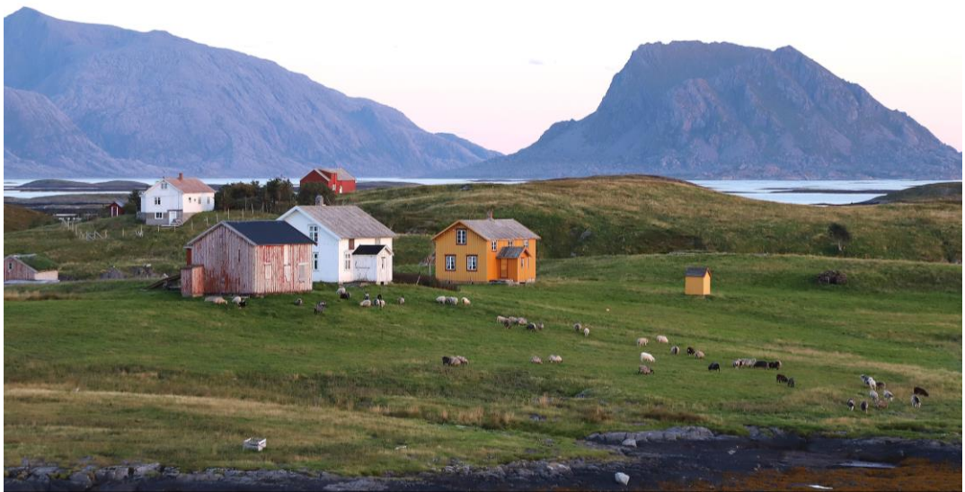
VEGA KOMMUNE FORVALTER KULTURLANDSKAPSMIDLENE SOM BEVILGES VIA LANDETS UTVIKLINGSFOND FOR Å STYRKE JORDBRUKET I VERDENARVOMRÅDET.

enkeltsøkere eller Stiftelsen. Av stillingsressurser har kommunen ellers hatt ca 10 -12 prosent av ordførers stilling som styreleder i Stiftelsen, hel stilling på reiselivsstrategi og en hel stillingsprosent på arbeidet med Konsekvensutredning Verdensarv - KUVA.