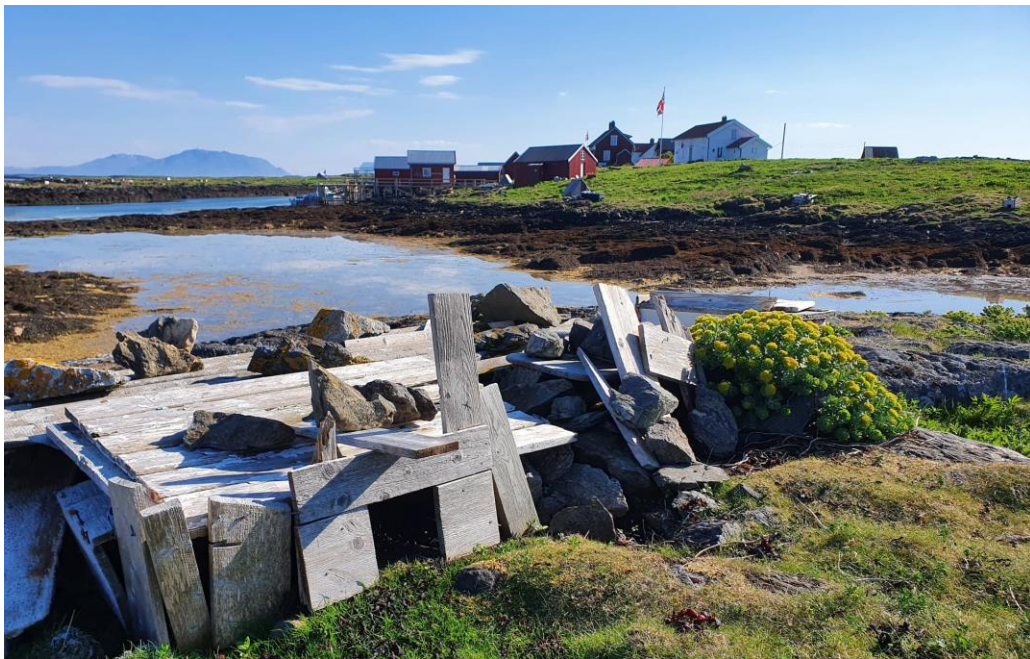
ÆRFLUGLARKITEKTUR I LÅNAN, DER DET GJENNOM EN ÅRREKKE ER SATT I STAND GAMLE EHUS OG EBANER.

I 2021 var det en utfordrende situasjon da tildelingen fra Nordland fylkeskommune ikke skjedde før i juni. Det gjør det svært vanskelig å få igangsatt tiltak samme år.