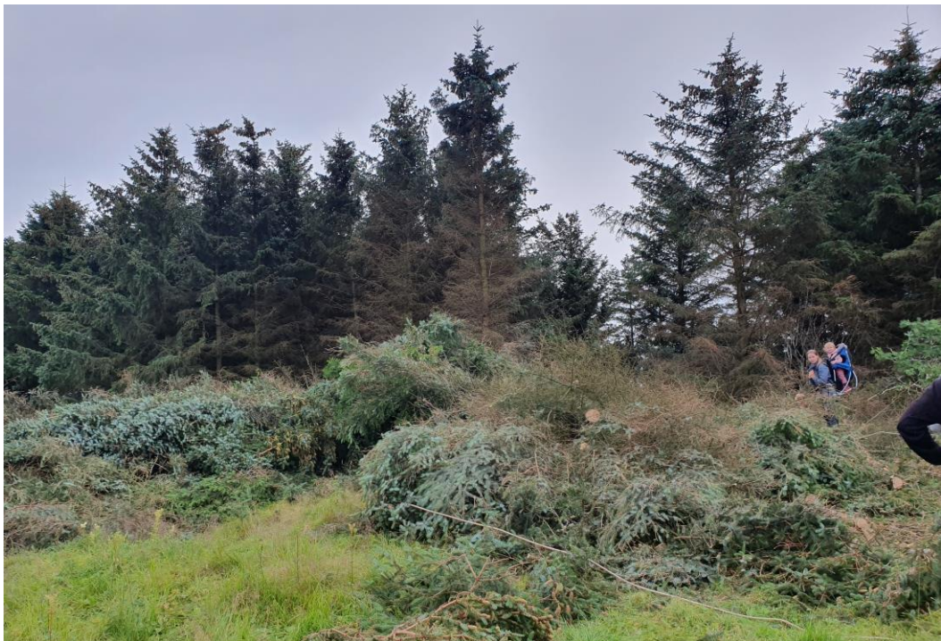
I KVALHOLMEN ER DET HOGD SITKA SÅ SAUENE KAN BEITE LANDSKAPET. DER SKAL ÆRFUGLTRADISJONEN TAS OPP I 2022.

Ca 3500 sitka er hogd av grunneierne på disse øyene. På Skogsholmen tas nå også buskfuru og kratt. Det meste av sitka er tatt ut i verneområdene, etter at det i 2021 ble tatt ut sitkafelt i Muddvær og Hysvær. Nå gjenstår bare et felt i Kjellerhaugvatnet. Også i buffersonen på Vega tas det nå ut store mengder sitka; mer enn 6000 kubikk de siste årene.