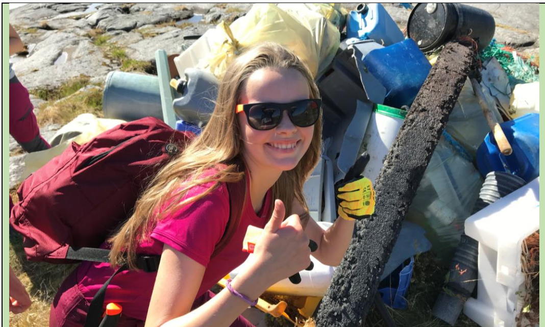
I PROSJEKTET "HOLD VEGAØYAN REN" VAR 20 UNGDOMMER I ALDEREN 14 TIL 16 ÅR ANSATT I 1 UKE HVER SOM STRANDRYDDERE. ARBEIDSLÉDER VAR ANSATT I 4 UKER FOR Å LEDE PROSJEKTET.

I sommersesongen var 9 personer ansatt i butikk og som guider i utstillingen.